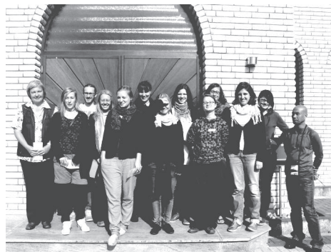
Moscheebesuch in Paderborn am 17.9.2011

Mittlerweile gibt es eine ganz beachtliche Steinesammlung und eine neue Be-