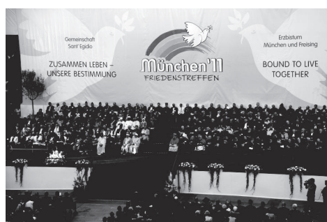
Verlesung, Übergabe und Unterzeichnung des Friedensappells München 2011

Der Bundespräsident verwies darauf, dass es derzeit viele Demonstrationen auch in Europa gebe. Dabei handele es